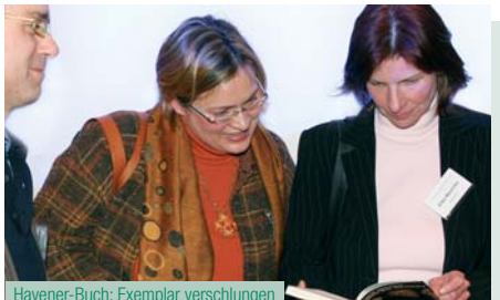
Havener-Buch: Exemplar verschlungen