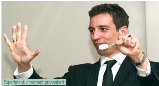
Experiment: charmant präsentiert