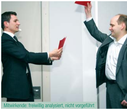
Mitwirkende: freiwillig analysiert, nicht vorgeführt