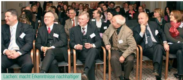
Lachen: macht Erkenntnisse nachhaltiger