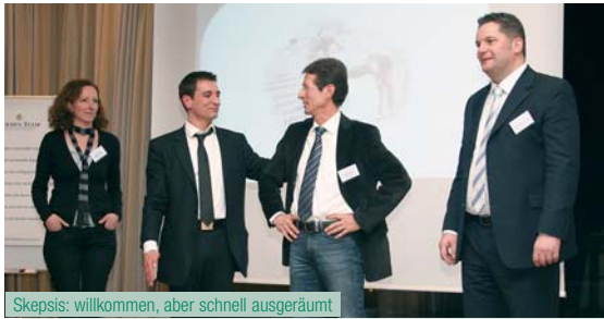
Skepsis: willkommen, aber schnell ausgeräumt