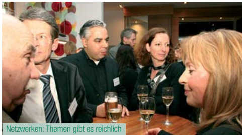
Netzwerken: Themen gibt es reichlich