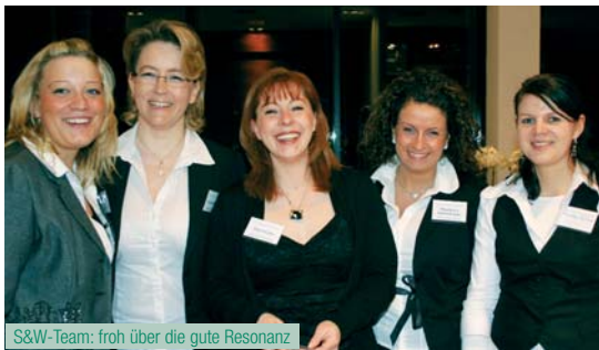
S&W-Team: froh über die gute Resonanz