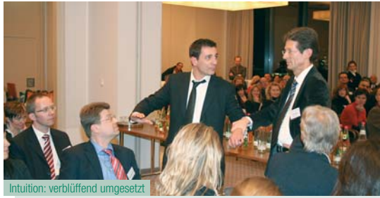
Intuition: verblüffend umgesetzt