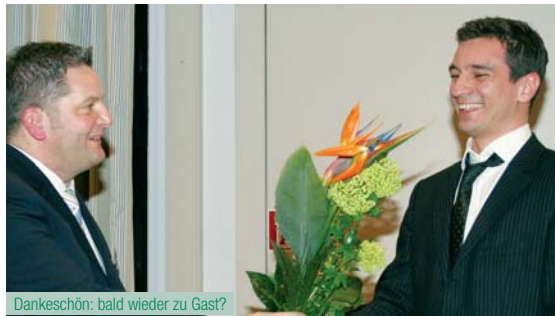
Dankeschön: bald wieder zu Gast?