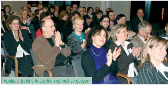
Applaus: Berlins Aussichten schnell vergessen